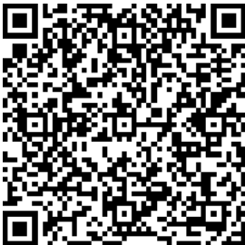
扫一扫在手机上查看当前页面

※这是习近平总书记2024年1月31日在二十届中央政治局第十一次集体学习时的讲话。