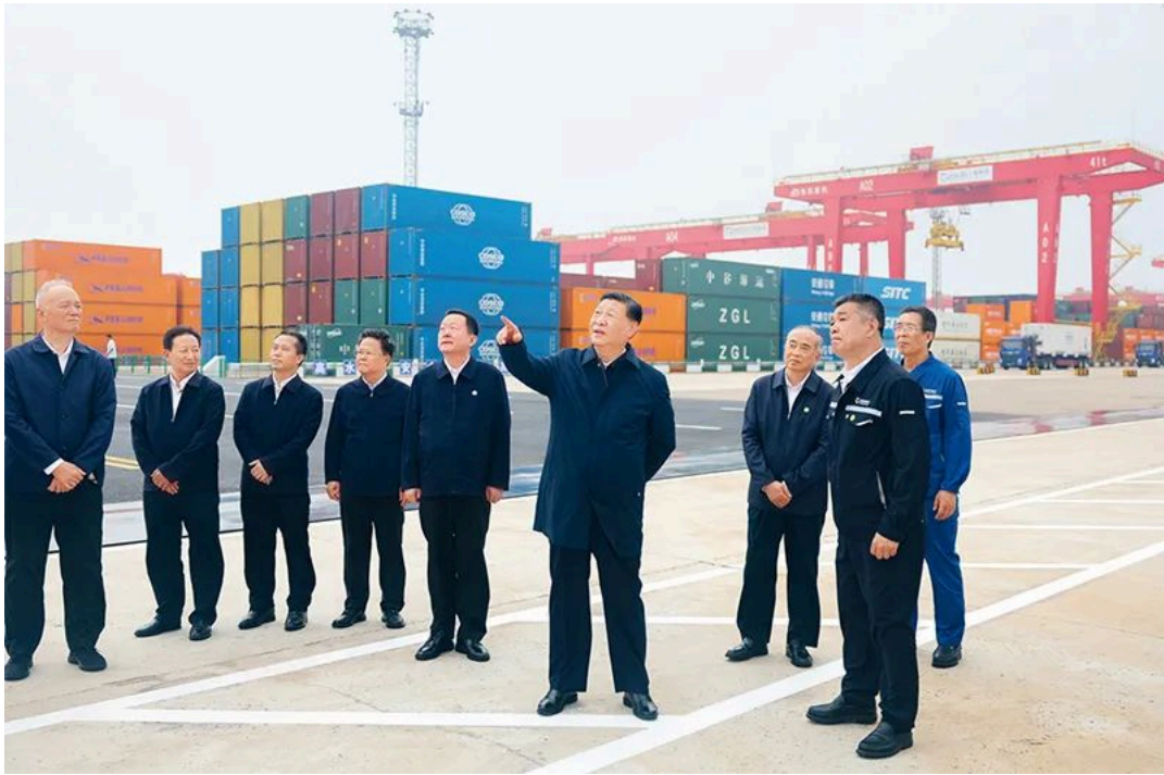
2024年5月22日至24日，中共中央总书记、国家主席、中央军委主席习近平在山东考察。这是22日下午，习近平在日照港察看全自动化集装箱码头作业场景。

第一，大力推进科技创新。新质生产力主要由技术革命性突破催生而成。科技创新能够催生新产业、新模式、新动能，是发展新质生产力的核心要素。这就要求我们加强科技创新特别是原创性、颠覆性科技创新，加快实现高水平科技自立自强。要深入实施科教兴国战略、人才强国战略、创新驱动发展战略，坚持“四个面向”，强化国家战略科技力量，有组织推进战略导向的原创性、基础性研究。要聚焦国家战略和经济社会发展现实需要，以关键共性技术、前沿引领技术、现代工程技术、颠覆性技术创新为突破口，充分发挥新型举国体制优势，打好关键核心技术攻坚战，使原创性、颠覆性科技创新成果竞相涌现，培育发展新质生产力的新动能。